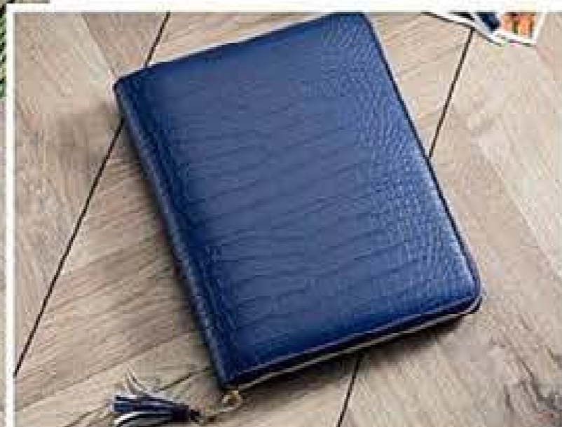
523167 BOLSA DE VIAGEM* ORGANIZADORA (MODA)

21 x 27 x 2 cm aprox. Poliuretano e poliéster. 28,99€