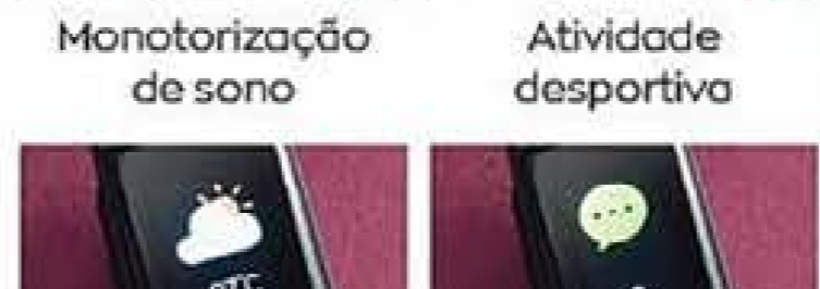
Alertas de tempo