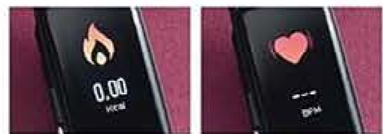
Contador de calorias