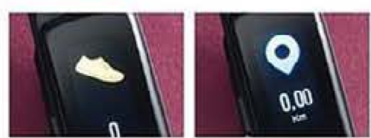
Contador de passos