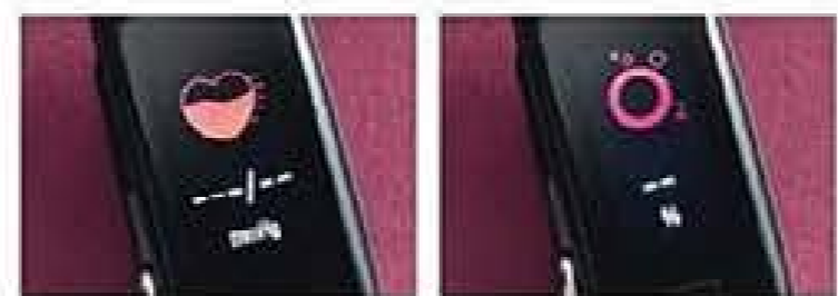
Medidor de pressão arterial