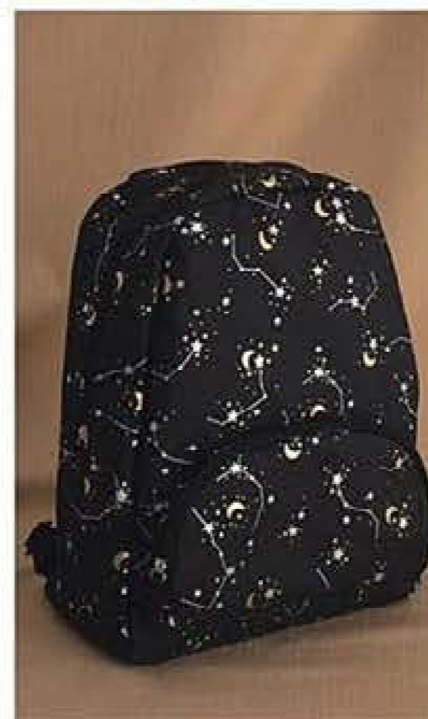
486795 MOCHILA DOROTHY (MODA)

Alças ajustáveis. 30 x 15 x 37 cm aprox. 100% Poliéster. 25,99€