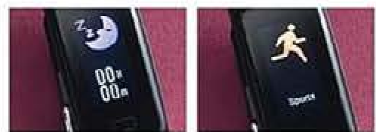
Monitorização de sono